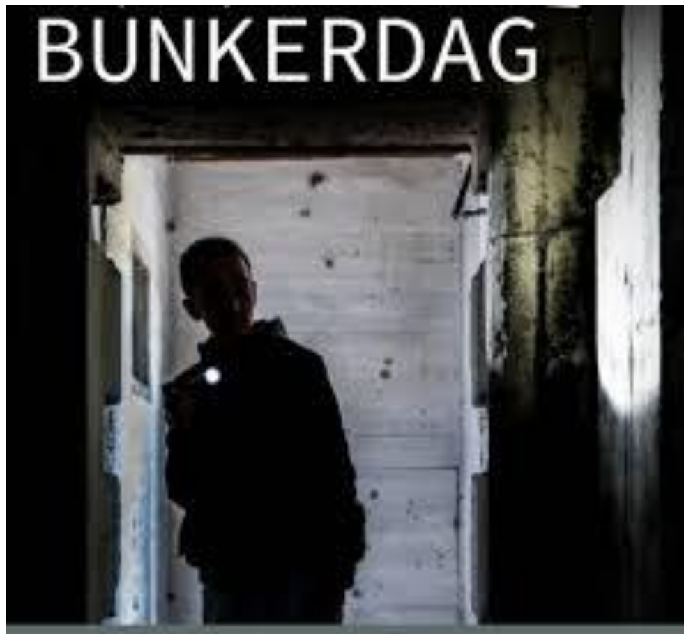
I.s.m. Nationale Bunkerdag