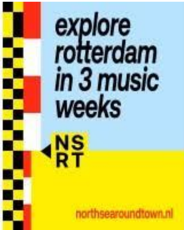
Muziek ism North Sea Round Town