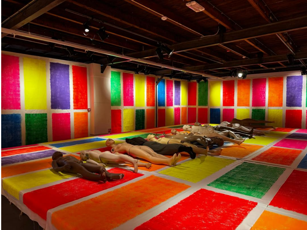
Open call met elevingskunst / afsluiting i.s.m. Fransje Killaars