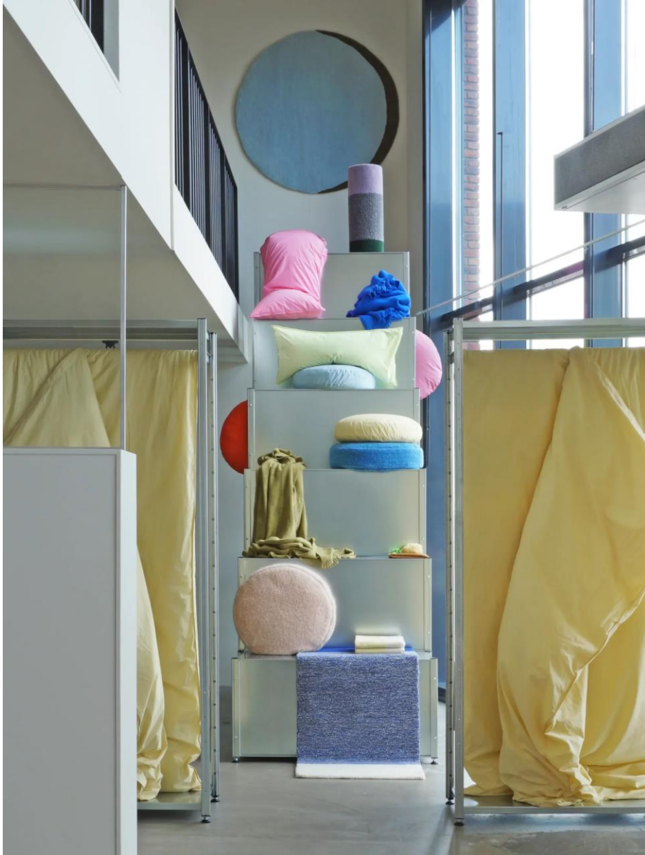
iCOON x Berry Dijkstra; shelter for design